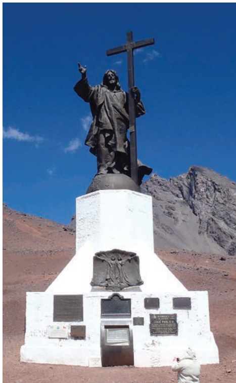
Na hranicích mezi Argentinou a Chile je poutní místo ve výšce 3 854 m.n.m., kterému od roku 1904 věvodí sedmi metrová socha Krista, jako symbol míru mezi oběma národy.

Sestoupili jsme do tábora Confluencia. Jako malou satisfakci jsme si ještě udělali výstup pod jihovýchodní stěnu Aconcagui do výšky 4 400 m.n.m. Pohled na horu z této strany patří jednoznačně k těm nejkrásnějším, ale z horolezeckého pohledu k těm nejtěžším. Byli jsme necelé tři kilometry pod vrcholem, ale i tak bylo jasně patrné, jak silný vítr vytvářel "závoje" sněhové masy až do vzdálenosti stovek metrů od hřebenu. Tady jsme pochopili, že v takových podmínkách se výstup uskutečnit nedal. Po dvou dnech sestupu jsme zpět na ubytovně. Když již sedíme u piva, přišla další skupinka tří unavených horolezců. Dáváme se s nimi do řeči a zjišťujeme, že byli zhruba o 1000 metrů výš a počasí je zahnilo dolů. S překvapením zjišťujeme, že to jsou kluci z Polska, což bylo pro další část naší výpravy klíčové. Angličtinu jsme vyměnili za své mateřské jazyky a do noci jsme vše důkladně probrali. Díky nim jsme dostali podstatně pozitivnější pohled na věc a co hlavně, dostali jsme od nich návrh na „náhradní“ program. Měli totiž namířeno do Chile.