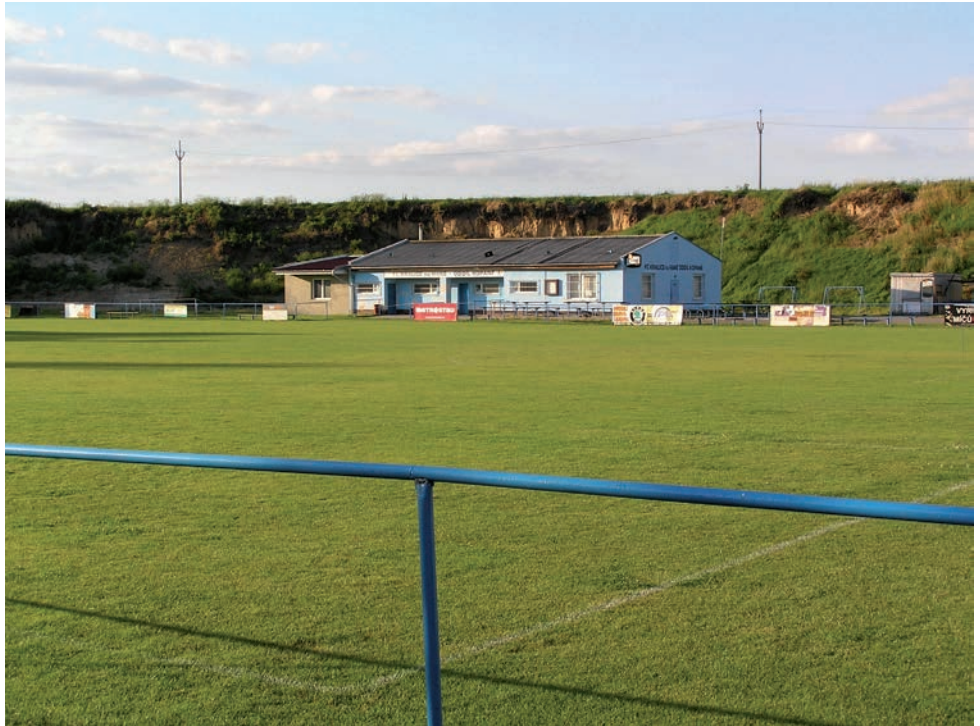
Současná podoba stadionu v pozadí se zrekonstruovanými šatnami.

V roce 1991 došlo k rozdělení a vznikly dva subjekty - TJ Sokol, které zůstala sokolovna a TJ Klas, které zůstalo hřiště. V tomto roce, tedy ve fotbalovém ročníku 1991/92, mužstvo mužů A vykopalo okresní přebor a postoupilo do 1. B třídy, kterou i v dalším ročníku 92/93 vyhrálo a postoupilo do 1. A třídy sk. A. V roce 1993 byla zrekonstruovaná hrací plocha fotbalového hřiště. Firma WARE (tak zněl i nový název klubu FC WARE Kralice na Hané) zakoupila z olomoucké Sigmy Androva stadionu pro ně špatnou trávu, ale v Kralicích slouží dodnes a je naší chloubou. Ročník 93/94 byl ve znamení velkých bojů s Velkými Losinami o postup do krajského přeboru. Toto se povedlo a od ročníku 94/95 hraje kralické A mužstvo krajský přebor s výjimkou ročníků 97/98 a 98/99, kdy jsme po utkání s Chropyní a inzultaci rozhodčího nuceně sestoupili zpět do A třídy. Do krajského přeboru jsme tehdy postoupili zpět z druhého nepostupového místa. Jako první postoupil Protivanov a my jsme museli tučně zaplatit. Ve vzpomínkách také nemůžeme zapomenout na pohárové utkání