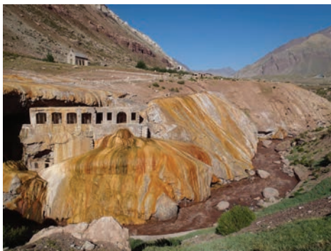
Turisticky atraktivní Puente del Inca. Dnes již opuštěná památka lázní, které vybudovali Inkové. Termální prameny vytvořily nádherné zbarvení okolních skal.

si veškeré vybavení nesli sami a část výstroje nám nesly muly, kterých se v údolí Horcones pohybuje nahoru a dolů desítky denně.