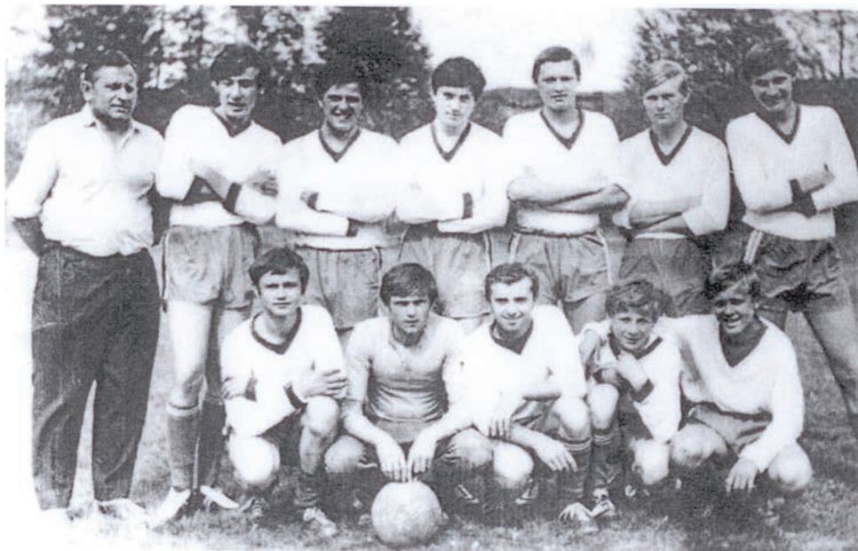
Dorost 1968 - 69 Sokol Kralice na Hané