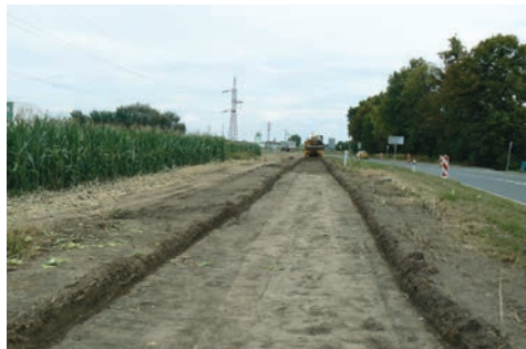
Výstavba cyklostezky spojující Prostějov s Kralicemi na Hané

Zásadní proměnou za posledních 10 let prošla většina ulic a uliček v Kralicích na Hané.