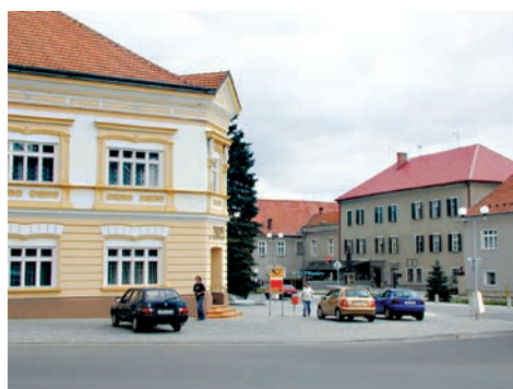
Hlavní třída v Kralicích na Hané po rekonstrukci