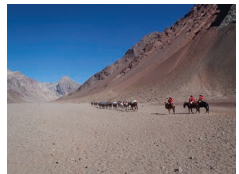
Údolím Horcones denně putují skupiny mul, které do základního tábora dopraví tuny materiálu a potravin, aby se těm, kdo mají štěstí na počasí, ulehčil výstup na vrchol.

vidíme základní tábor Plaza de Mulas 4 300 m.n.m. Celé údolí je dlouhé 33 km s převýšením více jak 2000 metrů. Trochu jsem litoval, že jsem těm mulám přeci jen nenechal více věcí z našich batohů. Na druhé straně jsme výstup brali nejen jako aklimatizaci, ale i velice kvalitní trénink. Další den jsme spíše relaxovali. Také jsme opakovaně prošli povinnou lékařskou prohlídkou, kde se testuje připravenost organismu pro další výstup. Reakce každého je různá a i vysoce trénovaný jedinec může v campu nedobrovolně strávit nějaký čas navíc, aby aklimatizace proběhla naprosto bezpečně.