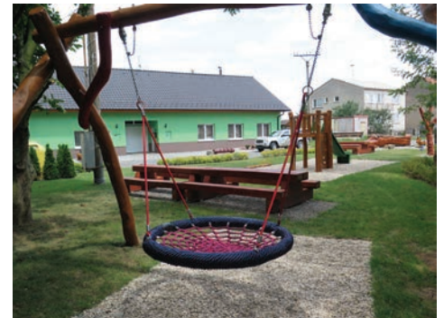
Odpočinková zóna v Kraličkách

Při zajištění běžného servisu pro naše občany se snažíme zaměstnat přes Úřad práce místní občany v předdůchodovém věku. Zastupitelstvo se snažilo a snaží o přátelské a korektní vztahy se všemi místními podnikateli zaměstnávajícími občany Kralic. Spolupracujeme se Svazkem obcí Prostějov - venkov a Místní akční skupinou Prostějov venkov o.p.s. Pravi-