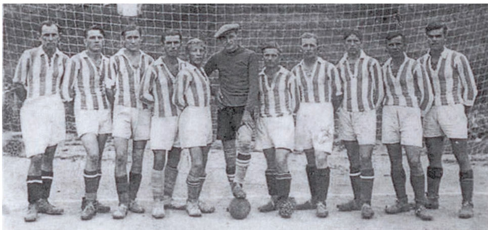
První zápas registrovaného klubu S.K. Kralice 12. srpna 1914