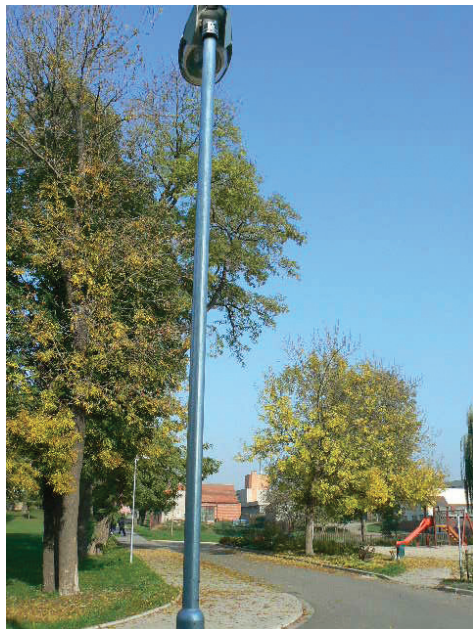
Rekonstrukce veřejného osvětlení

Vybudovali jsme nové třetí oddělení. Stávající dětské hřiště v mateřské škole letos nahradíme novým dětským hřištěm přírodního typu. Na jeho vybudování se bude podílet SFŽP (Státní fond životního prostředí). Základní škola prošla také kompletní rekonstrukcí. Opravili jsme a vybavili třídy nejen nábytkem, ale i nutnými školními pomůckami (interaktivní tabule, výpočetní technika). Budova základní školy byla odkanalizována, zrekonstruovali jsme vodo-