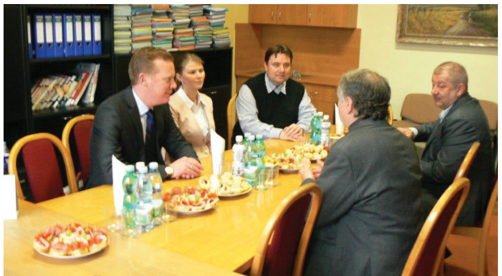
Setkání zástupců Kralic na Hané a WHP