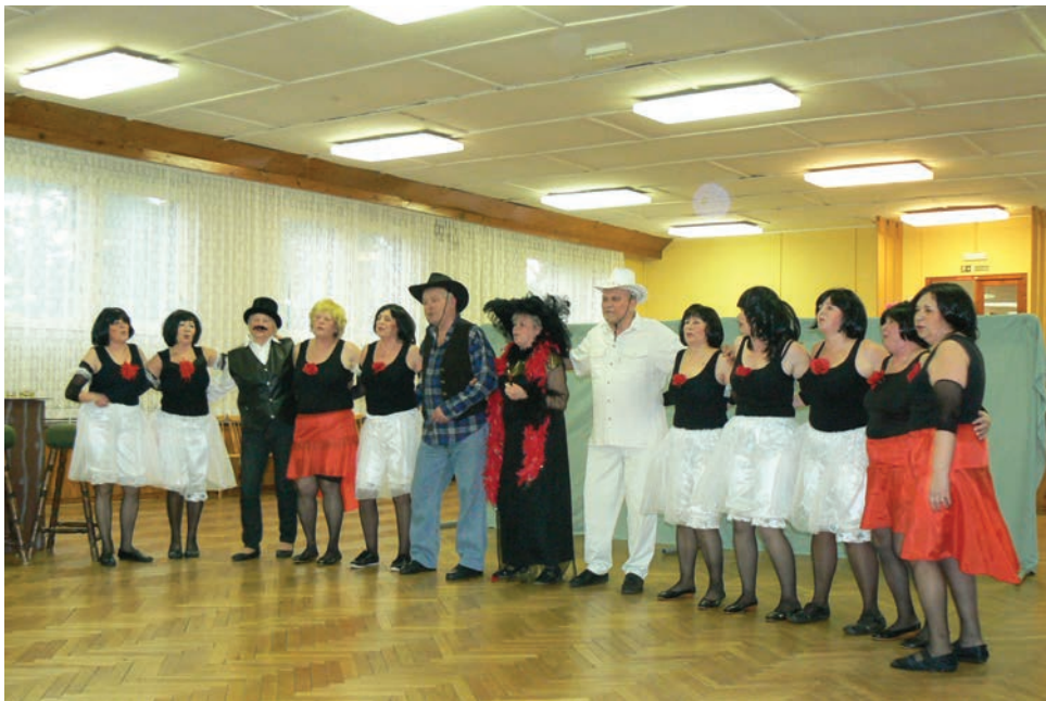
V letošním roce bylo naším „hitem“ tanečně-dramatické pásmo nazvané „Tenkrát na Západě“.

Vždy nás velmi mrzí, že během prázdnin a dovolených, kdy je letních akcí nejvíce, musíme nabídky odmítat, protože choreografie nedovoluje s menším počtem účinkujících vystoupit.