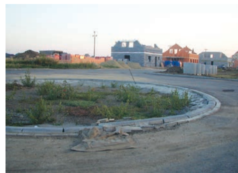
Výstavba lokality Bedihošská Komárov

V roce 2004 žilo v Kralicích na Hané 1417 obyvatel, k 1.1.2014 1501 obyvatel. To je nárůst