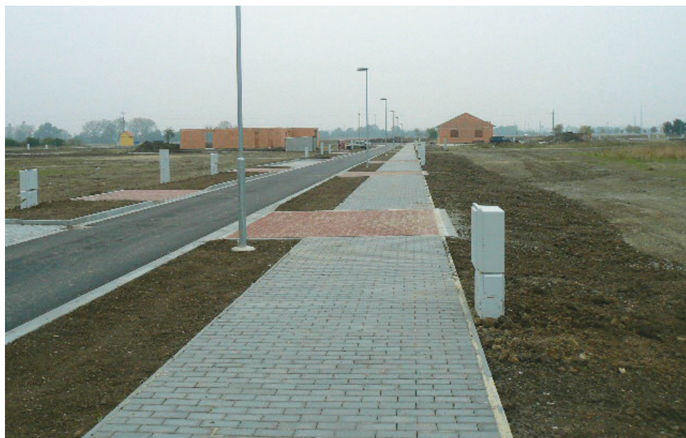
Výstavba lokality Na Výsluní

lu. Mateřská škola, která byla postavena v 70. letech prošla důkladnou rekonstrukcí. Zrekonstruovali jsme třídy, sociální zařízení včetně zázemí pro pracovníky, inženýrské sítě, osvětlení, provedli výměnu oken a dveří, zateplila se fasáda a oživil ji její vzhled novými barvami.