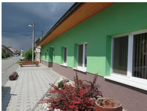
Ulice v Kraličkách

vyšli vstříc všem podnětům, požadavkům, ale i námitkám našich občanů.