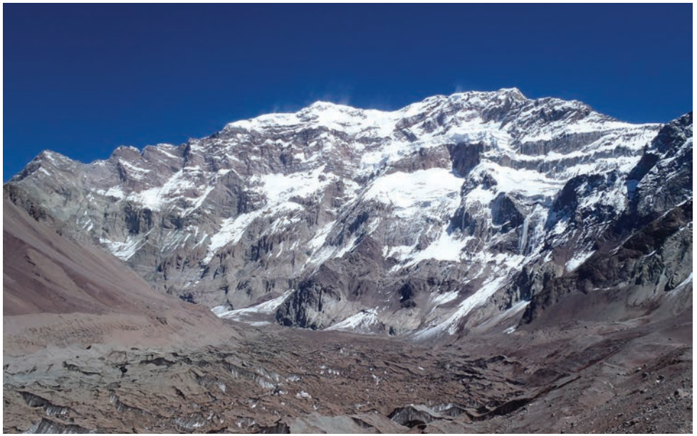
Pohled na Aconcaguu z jihovýchodní strany. V údolí pod ní pomalu postupuje obrovský ledoec, který se táhne několik kilometrů do údolí a který je úplně pokryt kamennou sutí.

Na vrchol se dá jít buď za pomoci některé z agentur, které vám zajistí poměrně velice slušný komfort. Nemusíte tahat stan, jídlo a plno dalších věcí, které jsou ve dvou postupných táborech Confluencia (3 400) a Plaza de Mulas (4 300) plně k dispozici. My jsme