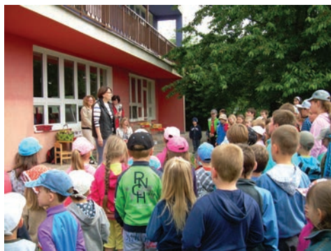
MŠ Kralice na Hané

lu. Mateřská škola, která byla postavena v 70. letech prošla důkladnou rekonstrukcí. Zrekonstruovali jsme třídy, sociální zařízení včetně zázemí pro pracovníky, inženýrské sítě, osvětlení, provedli výměnu oken a dveří, zateplila se fasáda a oživil ji její vzhled novými barvami.