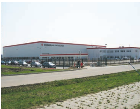
První hala v roce 2005 v Kralickém Háji

Windmüller & Hölscher Prostějov k.s. konstruuje a staví stroje a systémy k výrobě a zpracování flexibilních obalů.