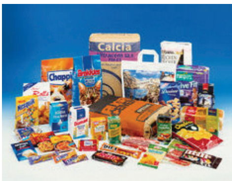
Obaly vyráběné na našich strojích

Windmüller & Hölscher Prostějov k.s. konstruuje a staví stroje a systémy k výrobě a zpracování flexibilních obalů.