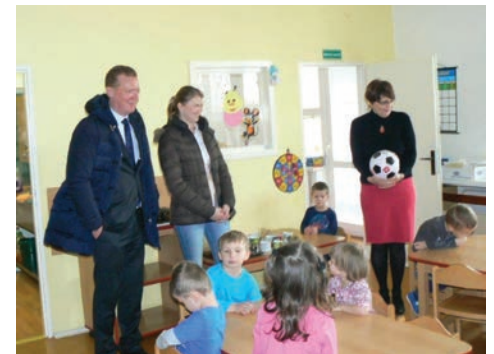
Návštěva Mateřské školy Kralice na Hané