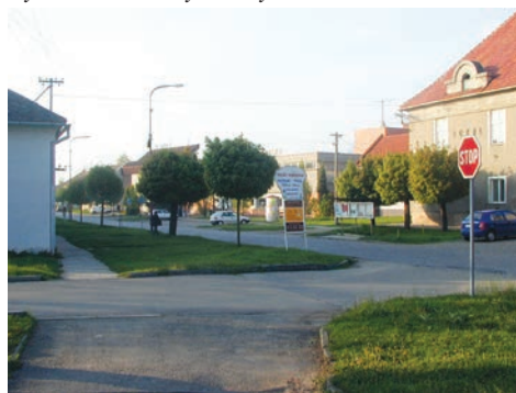
Hlavní třída v Kralicích na Hané před rekonstrukcí

Vybudovali jsme nové třetí oddělení. Stávající dětské hřiště v mateřské škole letos nahradíme novým dětským hřištěm přírodního typu. Na jeho vybudování se bude podílet SFŽP (Státní fond životního prostředí). Základní škola prošla také kompletní rekonstrukcí. Opravili jsme a vybavili třídy nejen nábytkem, ale i nutnými školními pomůckami (interaktivní tabule, výpočetní technika). Budova základní školy byla odkanalizována, zrekonstruovali jsme vodo-