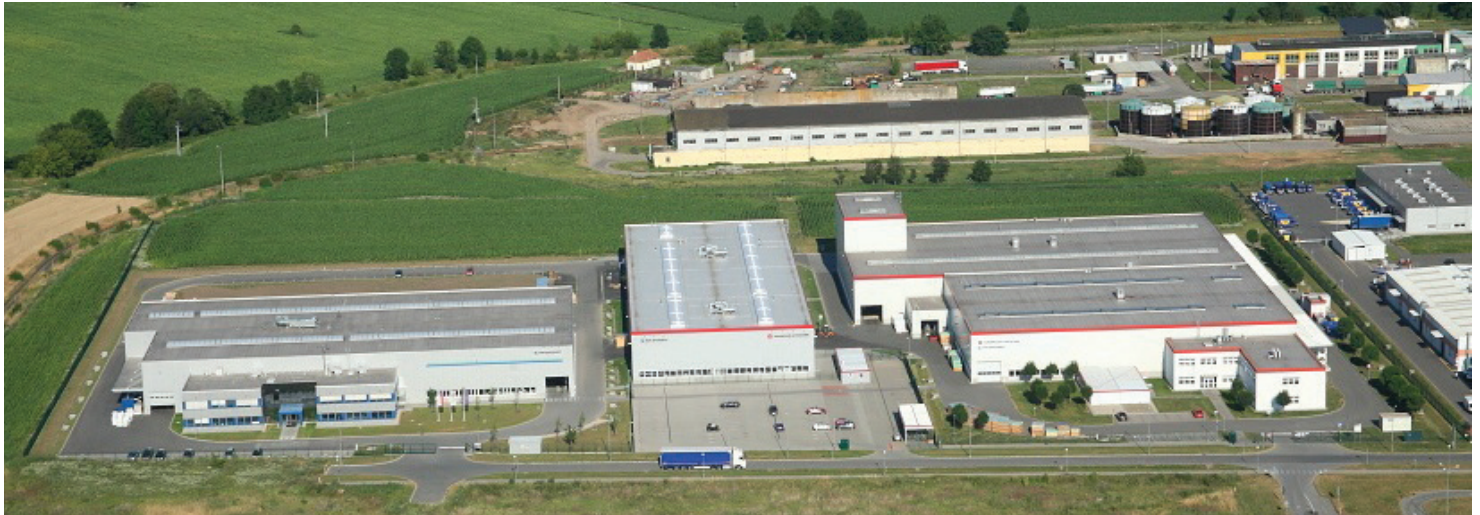
Současný pohled na areál Windmüller & Hölscher v průmyslové zóně (zleva: BSW, logistické centrum, WHP)